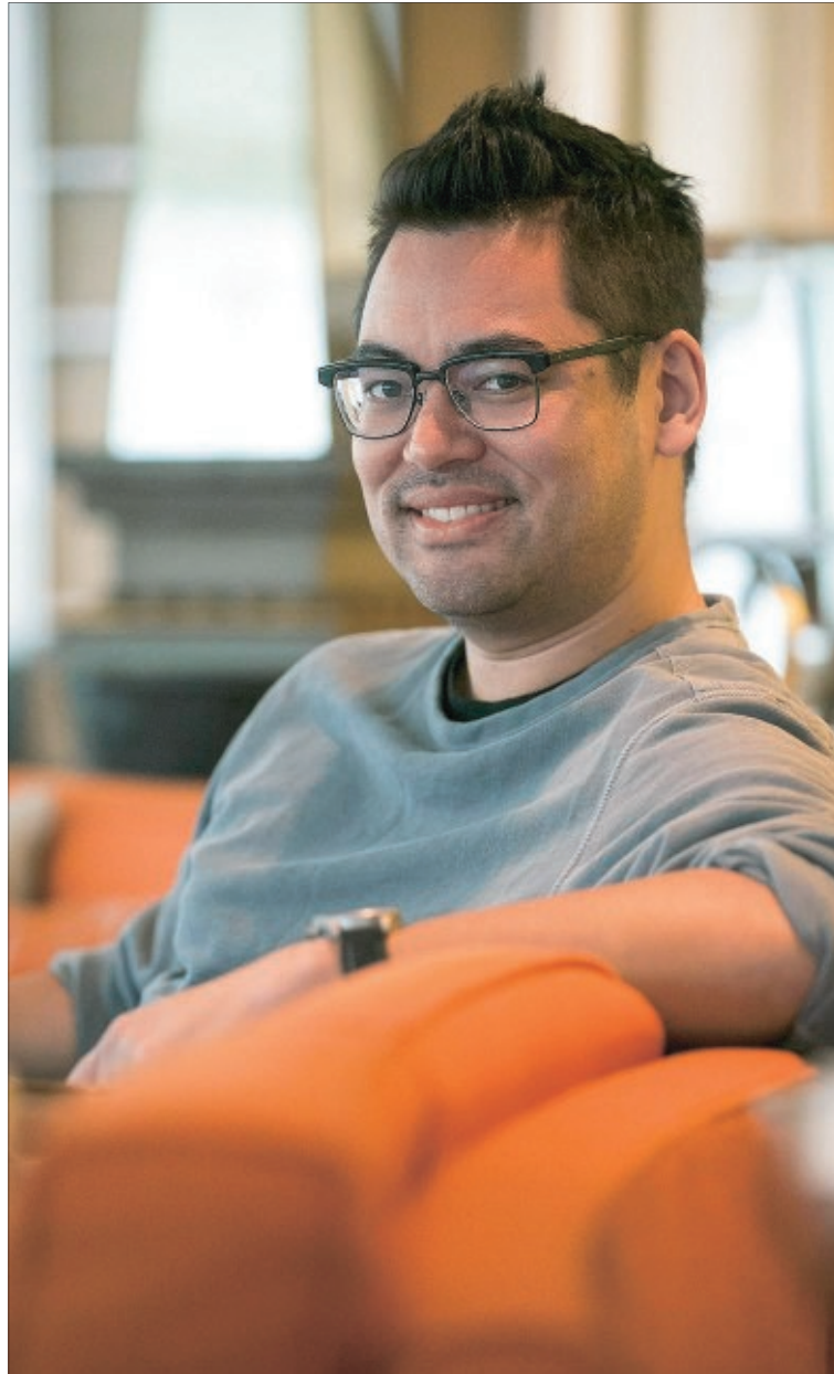
El dibujante Bryan Lee O'Malley, ayer, en Barcelona