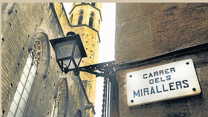
Al carrer Mirallers (Barcelona) hi ha la Casa d'Oracions

Precisament per la velocitat, la gosadia formal, els canvis de punt de vista i la "llengua pre-xava", que diu Enric Casasses, l'aposta de Verdaguer Edicions, de brindar-nos el text a través de la mirada d'un poeta contemporani, és molt benvinguda. Casasses és un bon coneixedor de l'obra i del context i s'ha interessat per aquesta Barcelona de finals del XIX de gran efervescència espiritista. Casasses parla de Verdaguer des de l'admiració i això ens l'acosta encara més als nostres dies. El poeta té una cosa que només és seva i de déu i que no la cedirà mai, i això és l'ànima. Lluny d'acusar Verdaguer d'una exageració de l'ego, Casasses ens explica que el poeta no és l'ovella del ramat, és un individu. El seu terreny d'actuació més idoni és l'església, el govern i els rics, encara que tampoc no se'ls esca-